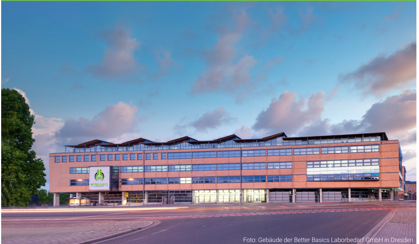
Foto: Gebäude der Better Basics Laborbedarf GmbH in Dresden